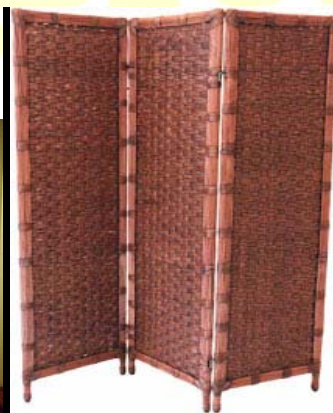
Figura 2 – Divisória artesanal

A TV Escola leva até a sua sala de aula os melhores documentários e séries de conteúdo educativo. Acompanhe nossa programação no Canal 123 da Embratel , no Canal 112 da SKY , no Canal 694 da Telefônica TV Digital ou gratuitamente sintonizando sua antena parabólica: analógica - Hor /Freq. 3770 e digital banda C Vert /Freq. 3965 Na internet acesse http://tvescola.mec.gov.br e assista ao vivo, 24 horas.