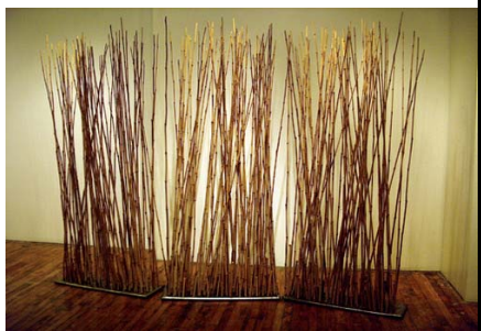
Figura 1 - Divisórias de interiores

Sugere-se também uma atividade menos complexa que consiste em analisar a obra “Porta de Treliça” e estudar sobre objetos de decoração de ambientes e conceitos tridimensionais. O professor deverá exibir o vídeo quantas vezes forem necessárias para que o aluno compreenda e faça associações com objetos de decorações que encontramos facilmente em nossas casas, escritórios e até na escola, cuja inspiração para produção são as portas de treliça do século XVIII, porém, com uma nova concepção de reaproveitamento de materiais, e que da mesma forma são tão úteis para dividir ambientes, evitar o superaquecimento e permitir a passagem da luz.