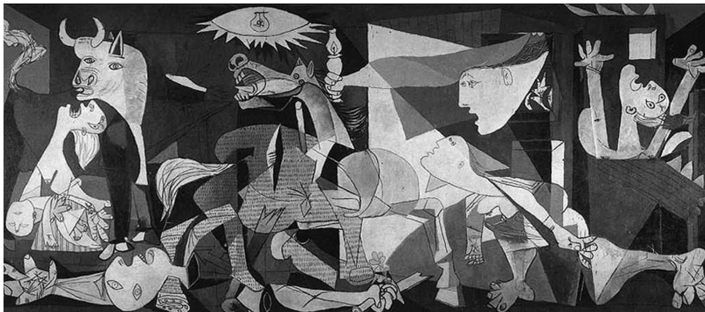
"Guernica" Pablo Picasso, 1937