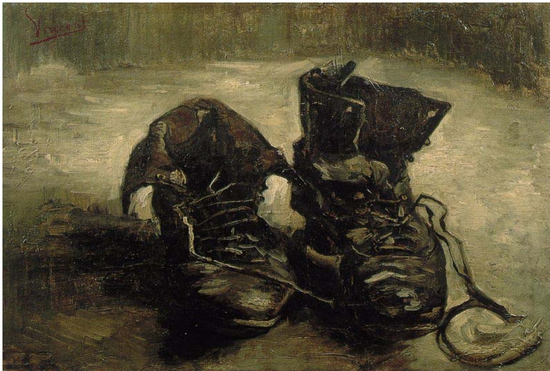
"Par de botas" Van Gogh, 1887